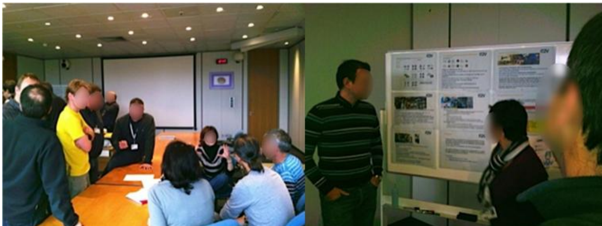
Feed back fait sous forme de forum entre 11h30 et 13h30 pour le personnel e2v

Au plus tard 15 jours après la visite, une synthèse de visite est réalisée (exemples: 5 slides associées à une présentation orale de 10 minutes ; feedback sous forme de forum).