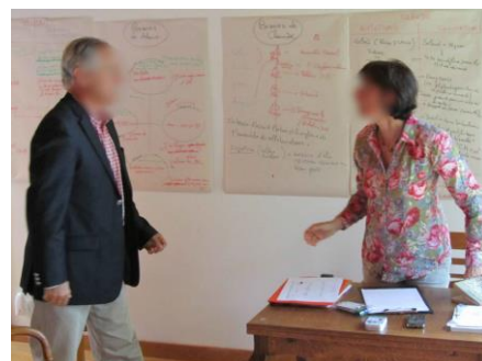
Une mise en situation