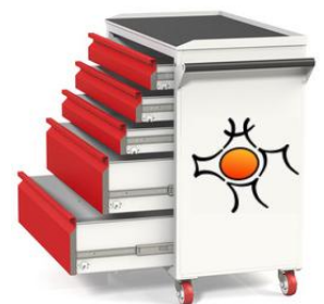
Servante à outils